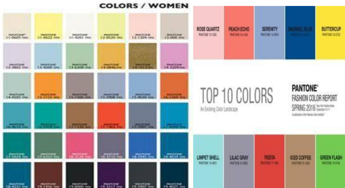
الدرجات اللونية لربيع وصيف ٢٠١٦ (١)

مختلفة وأشكال مختلفة للتصميمات طبقاً للشرائح العمرية المختلفة للسيدات ، ومحاولة الباحثة عند التصميم مراعاة التوفيق بين ألوان الموضة المتجددة والخاصة بموسم (ربيع / صيف ٢٠١٦) والحفاظ على الهوية المصرية من خلال إستخدام الرموز الخاصة بحرفلقلى كأحد الحرف اليدوية المصرية.