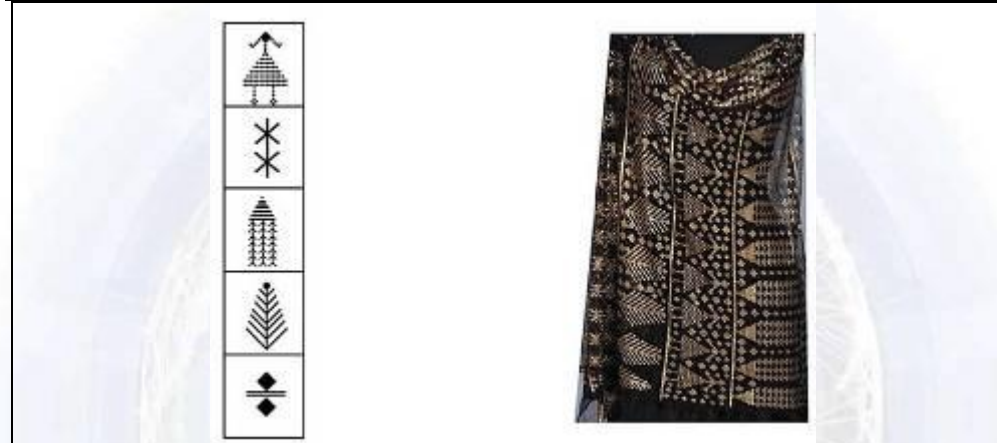
جدول رقم (٣) يوضح: أبجدية الأشكال والرموز المستخدمة في التطريز للشكل رقم (٣) - من عمل الباحثة