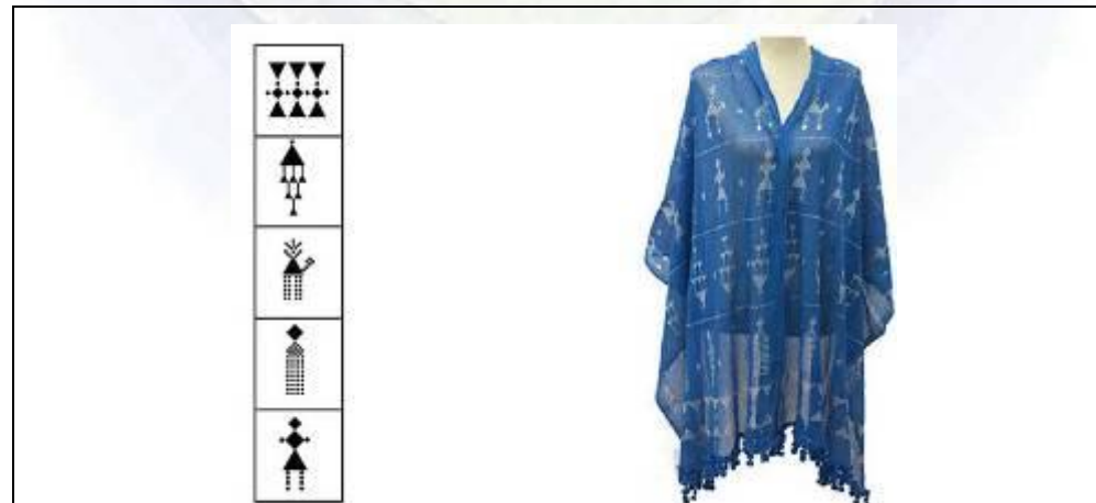
جدول رقم (٤) يوضح: أبجدية الأشكال والرموز المستخدمة في التطريز للشكل رقم (٤) - من عمل الباحثة