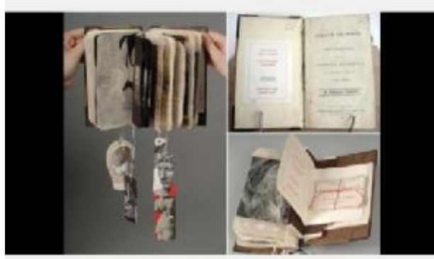
شكل (١٢) الفنانة كيرا كليج- كتاب حول قواعد النحو في اللغة الفرنسية