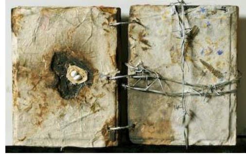
شكل (٢٠) كتاب شعر - غسان جائب شكل (٢١) كتاب الاحتلال - غسان جائب ٢٠٠٤م - ٣١.٥x٥٩سم ٢٠٠٧م - ١٨x١١سم