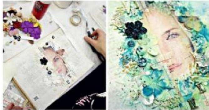
شكل (١٣) صفحات من كتاب لا شيء يتغير Kasia Krzyminska-Nothing is changing