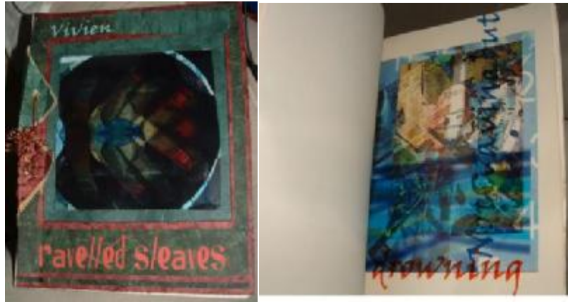
شكل (١٠) (١) فيفيان بلاكبيرن Vivien Blackburn Ravelled Sleeves - ٢٠٠٧م