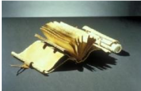
شكل (١) هايديكايل - سجل القطار - ١٩٩٦م - مقاس ١٩x١٦x٦سم

شكل (١) كتاب للفنان "هايديكايل" HeidiKyle بعنوان "سجل القطار" Train Log وهو كتاب ملفوف عبارة عن قطعتين ، إستخدمت في انجازه أكثر من مادة وخامة مهمة من ورق مجعد وجلد وورق فلورنسا مرسوم فوقه بمشروب القهوة ، وقماش كتان مخاط مع قطع من المشمع ومناديل ورقية وعصا خشبية مغطاة بورق ياباني والكتابة بأقلام خشبية ملونة وقد حققت الفنانة قيمة فنية عالية في عملية توليف ودمج المواد والخامات (١) .