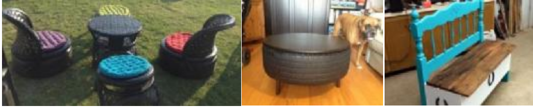
شكل (٤) (١)

النفائيات ولإعادة تشكيلها في أعمال فنية نبيلة المهام والوظائف شكلي (٣)،(٤) قطع أثاث من بواق الأخشاب وإطارات السيارات القديمة.