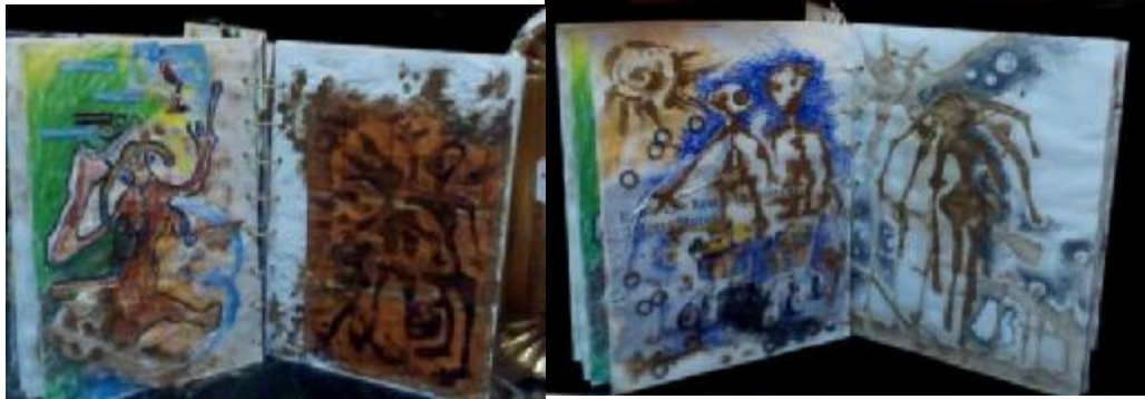
شكل (٣٦) زوايا مختلفة لشكل الكتاب وبعض الصفحات الداخلية