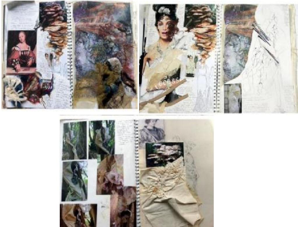
شكل (٦) صفحات لكتاب حليلة أختار

ولقد عبرت الفنانة الهندية " حليلة أختار " Halima Akhtar عن ذلك بقولها شئ جميل أن يستطيع الفنان أن يظهر عناصر مهملّة لاقيمة لها وغير ملحوظة في البيئة المحيطة ويرازها بشكل جميل وتسلط الضوء على تلك العناصر بعد إضافة بعض اللمسات الفنية البسيطة ، فلقد إستلهمت الفنانة عناصرها من الطبيعة، حيث تعاملت مع العناصر ولمستها عن قرب مثال شرنقة الفراشات وعش الغراب والأشجار ورسمت ليكنشات تفصيلية لها ولستعانت بالصور الفوتوغرافية وعملت تداخل بين عناصر من مخلفات البيئة كالقصاصات الورقية والقماش والأزرار والاعشاب وقطع المعدن... الخ ، شكل (٦) قامت الفنانة بعمل رسوم تفصيلية لطبقات الصخور وجذوع الشجر وقامت بتلوينها ، ودمجت بين تلك الرسوم وبعض العناصر البيئية حيث قامت بعمل تقطيعات فأنسجة بعض المخلفات العضوية كالأقمشة وقصاصات الورق وأوراق الأشجار ولعادة تشكيلها لتصميم أشكال جديدة بارزة وذات أبعاد كما إستعانت ببعض الكتابات لملاحظاتها (١) .