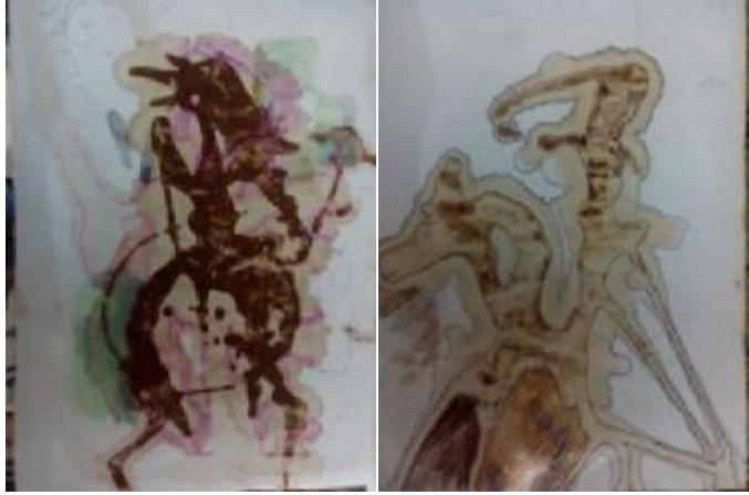
شكل (٢٣) بعض الرسوم الأولية للكتاب