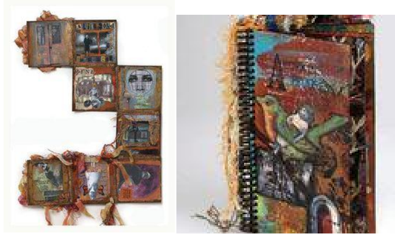
شكل (١٤) الكتاب المتعرج meander book -سوزى لافوند