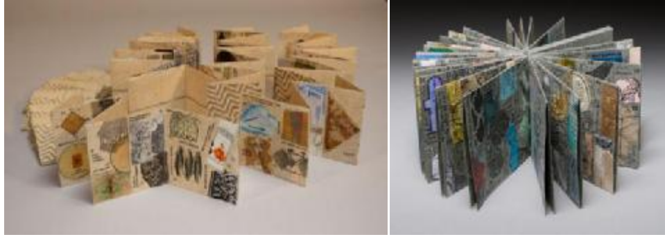
شكل (٨) كتاب I went to sleep, where did I go

صدقات، ريش طيور، حصى، ويمكن إستخدام مواد خردة مثل: ألعاب مهملة، زجاج مكسر، أدوات مطبخ، سيديهات الكمبيوتر الناقله..للخ،حيث تُجمع هذه القطع وتلصق على صفحات الكتاب يدويا وتجميع هذه الصفحاتتفعلياً وتكوين كتاب الفنانمثال أعمال الفنانة الأمريكية "جينى شينك" GenieShenk (١٩٣٧ - ) شكلى(٧)،(٨)،(١)حيث سجلت الفنانة كل أحلامها فى شكل مرئي، مستعينة ببعض السجلات السنوية كمصدر لأفكارها وبعض المطبوعات وقطع متنوعة من الأوراق الكتب القديمة للقواميس والأطلس والسى دى والأزار .