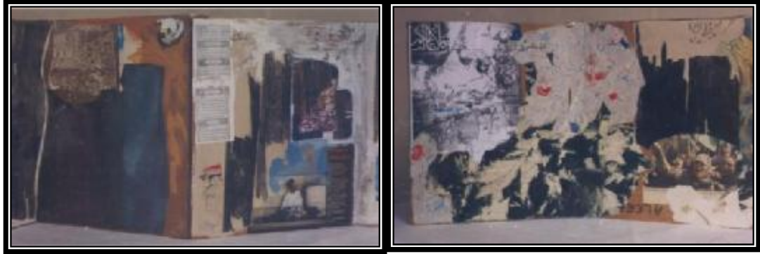
شكل (١٨) مقاطع من بعض الصفحات الداخلية للكتاب مريم عبد العليم- الإسلام تحت حصار - ٢٠ × ٣٥ سم - ٢٠٠١م

لقد وجد الفنانون في "مصر" والوطن العربي في شكل كتاب الفنان الكولاجي الوسيلة المناسبة لتقديم أعمالهم الفنية التي تعبر عن أفكارهم، بالقصص أو بالمفاهيم، فأخذوا يقومون بتجارب رائدة في كل الإتجاهات والأفكار والمفاهيم الفنية المعاصرة، مثالا لفنانة المصرية "مريم عبد العليم" Marriam Abdell Aleem (١٩٣٠ - ٢٠١٠) وكتاب فني بعنوان " الإسلام تحت حصار العولمة"، ولقد عبرت الفنانة عن الكثير من الأحداث والقضايا السياسية التي تشغل العالم العربي مثل القضية الفلسطينية والعراقية (١) ، شكل (١٨) نجد أن الكتاب يتكون من ست صفحات، في الواجهة الأمامية، وست أخرى خلفيه ، وتعتبر كل صفحة تكوينا وعملا فنيا مستقلا، ولكنها لا تتفصل عن بقيه الصفحات فكل الصفحات تكمل بعضها بعضا كوحدة فنية متكاملة، حيث قامت بدمج خامات متنوعة مثل قصاصات الورق الياباني والورق المصنع يدويا مثل ورق القطن وورق البردي وطبقات كولاج من بعض الصور الفوتوغرافية المقطوعة يدويا وأجزاء من أعمال الطباعة الفنية للفنانة مع بعض الرسوم اليدوية بالألوان المائية والجواش والاكريك.