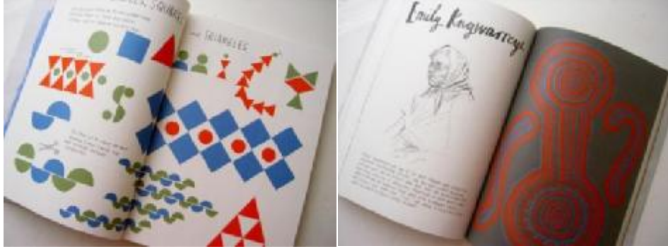
شكل (١٦) كتاب Draw Paint Print Like the Great Artists – للفنانة Marion