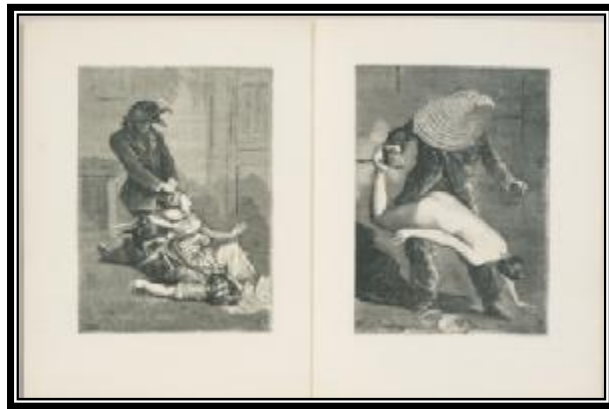
شكل ( ١١ ) ماكس أرنت - ١٩٣٤م - العناصر السبعة الرئيسية" - ٢٧.٣ × ٢٠.٥ سم

وفى شكل (١٣) قامت الفنانة البولندية "كاسيا كرازينشكا" Kasia Krzyminska بتنفيذ كتاب الفنان الخاص بها فوق كتاب قديم ، حيث عبرت عن مشاعرها بدون إستخدام للكلمات ، بإستخدام قطع الخردة فى تصميم صفحات كتبها المختلفة فهى تبحث عن الإلهام فى كل مكان فى الصفحات والكتب القديمة فى المخلفات المنزلية من أقمشة وأزرار ودهانات .الخ. حيث تنظمهم فى طبقات ذات ملابس مختلفة (٢).