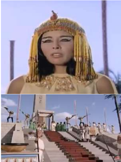
شكل (١٢) لقطات من فيلم "عروس النيل" أثناء عرض مراسم احتفالية "وفاء النيل" -

غرام في الكرنك فيلم مصري تم إنتاجه عام ١٩٦٧، من إخراج وتأليف علي رضا- سيناريو وحوار محمد عثمان- بطولة محمود رضا وفريدة فهمي، تم تصوير العديد من المشاهد في معبد الكرنك بمدينة الأقصر، ويدور موضوع الفيلم في إطار استعراض اجتماعي فكاهي، ظهرت فيه الاستعراضات المتنوعة والمستمدة من الثقافة والطابع المصري التي تميزت به فرقة رضا، وضح ذلك جليا في الزيِّ والأداءات والرقصات التي تم تقديمها بين جنبات وأروقة معبد الكرنك بالأقصر، الأمر الذي ساهم في تقديم صورة ذهنية إيجابية وفضول لدى المشاهد لحضور هذه العروض والاستعراضات الفلكلورية بين جنبات الأماكن الأثرية والتاريخية.