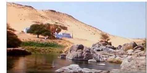
شكل (١٨) لقطات من فيلم "مافيا" ومواقع التصوير في أسوان- https://www.youtube.com/watch?v=8gMhFKBo-1U