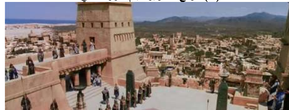
شكل (٦) لقطة من فيلم طروادة

http://haka9e.blogspot.com/2014/08/blog-post_83.html