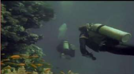
شكل (١٧) لقطة من فيلم "جحيم تحت الماء" https://www.youtube.com/watch?v=oKpVFcFSIg4