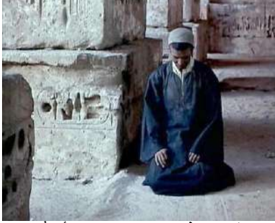
شكل (١٥) لقطات من فيلم (المومياء) "يوم أن تُحصى السنين" https://voicethrower.wordpress.com/2011/08/21/the-night-of-counting-the-years/

ومن المقاصد السياحية الشاطئية التي ظهرت في الأفلام السينمائية المصرية، مدينة مرسى مطروح وشواطئها، خاصة صخرة شاطيء الغرام بمطروح التي سُميت على اسم فيلم "شاطيء الغرام" انتاج ١٩٥٠- اخراج هنري بركات- بطولة ليلى مراد، حسين صدقي، والتي تُعد من أهم مزارات مرسى مطروح حتى الآن، كذلك يُعد فيلم "جحيم تحت الماء" انتاج ١٩٨٩- اخراج نادر جلال- بطولة سمير صبري، ليلى علوي، والذي تم تصويره في الغردقة فيه ترويج غير مباشر للسياحة في البحر الأحمر وممارسة رياضة الغطس ومشاهدة الشعب المرجانية، كذلك فيه إشارة إلى تجريم صيد الأسماك بالديناميت، وظهر في الفيلم لقطات عديدة لأوتيل الشيراتون والذي كان على رأس أشهر أوتيلات الغردقة حينذاك.