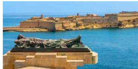
شكل (٥) موقع تصوير فيلم طروادة في مالطا

ساهمت شهرة فيلم الملحمة والبطولة الأسطورية "طروادة" في الترويج للسياحة بجزيرة مالطا في البحر المتوسط، حيث أن غالبية مشاهد القتال والحرب في الفيلم تم تصويرها في مالطا ومشاهد قليلة في المكسيك، ولقد تم بناء الشوارع والساحة الكبرى لمعركة "طروادة" على مساحة ١٠ فدان في قلعة "ريكاسولي" الواقعة على مرفأ "فالييتا" في مالطا، بينما تم تصوير المشاهد الداخلية بما في ذلك قصر طروادة في استوديوهات "شبيردون" في إنجلترا.