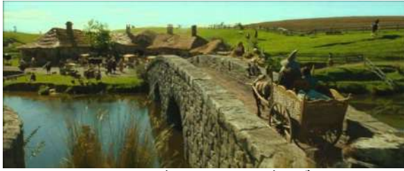
شكل (٢) لقطة من فيلم ملك الخواتم الذي تم تصويره بين مروج نيوزلندا - https://vimeo.com/88138797