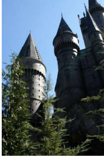
شكل (١) موقع تصوير مدرسة هوجورتس في فيلم هاري بوتر

أسهمت سلسلة أفلام هاري بوتر في زيادة شهرة بريطانيا كموقع لتصوير الأفلام العالمية، بما قدمته من عالم الخيال الافتراضي المليء بالخرافة المبهرة والأحداث غير المتوقعة، فمدرسة "هوجورتس" الشهيرة للسحر والشعوذة في فيلم هاري بوتر تجذب آلاف السياح إلى إنجلترا للتعرف على سحر القرى الإنجليزية والكنائس والأديرة والأبنية الأثرية، كما أن جامعة "كسفورد" العريقة تستقبل حشوداً كبيرة من السياح بحيث يمكنهم أن يعيشوا الأجواء الحقيقية للفيلم، وزيارة الأماكن التي تم التصوير بها، كما تستقطب محطة قطارات لندن "كينج كروس" الكثير من محبي "هاري بوتر" الذين يلتقطون الصور التذكارية ويقومون بتقليد بعض المشاهد من الفيلم، بالإضافة إلى إمكانية زيارة ستديوهات warner brothers وزيارة المتحف الخاص بالديكورات والملابس والكائنات التي ظهرت في الفيلم.