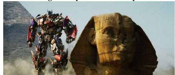
شكل (١٠) لقطة من فيلم Transformers تم تصوير بعض مشاهد بمنطقة الأهرامات

https://www.theguardian.com/film/2010/nov/06/fair-game-skyline-into-eternity