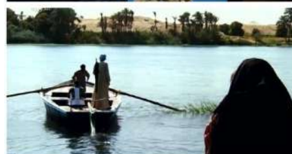
شكل (١٩) لقطات من فيلم "الجزيرة" ومواقع التصوير في أسوان- https://www.youtube.com/watch?v=sv_Jjd6-D_Y