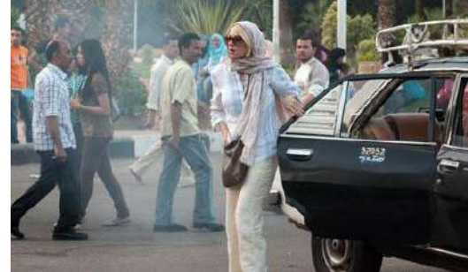
شكل (٩) لقطة من فيلم Fair Game تم تصوير بعض مشاهد بمدينة القاهرة

https://www.cinema.de/film/jumper,91036.html