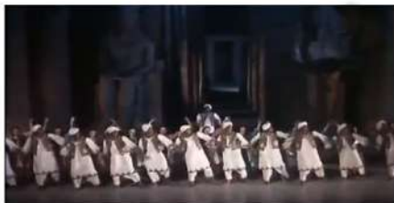
شكل (١٣) لقطات من فيلم "غرام في الكرنك"

https://www.youtube.com/watch?v=qku_E4nbfAY