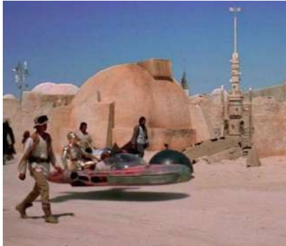
شكل (٧) منطقة نفثة في تونس موقع تصوير فيلم حرب النجوم

http://haka9e.blogspot.com/2014/08/blog-post_83.html