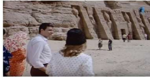
شكل (١٤) لقطات من فيلم "الحقيقة العارية"

https://www.youtube.com/watch?v=SbNzVZ8RvN8