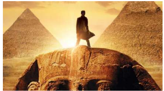
شكل (٨) لقطة من فيلم Jumper تم تصوير أحد مشاهد على سفح الأهرامات

بمعبد الكرنك- محافظة أسوان بمعبد أبي سمبل- مسجد بن طولون بالقاهرة)، فيلم (الموت على النيل) Death on the Nile 1978 الذي تم تصوير بعض المشاهد في منطقة الأهرامات، فيلم (جالبولي) Gallipoli 1981 الذي تم تصوير بعض المشاهد في (القاهرة- الجيزة- منطقة الأهرامات)، فيلم (سيريانا) Syria 2005 الذي تم تصوير بعض المشاهد في (العاصمة القاهرة)، وفي القرن الواحد والعشرين شهدت الأقصر ومنطقة أهرام الجيزة على تصوير مشاهد أفلام مثل: فيلم JUMPER 2008 الذي صورت أحد مشاهد على سفح الأهرامات، وكذلك فيلم TRANSFORMERS 2009، فيلم FAIR GAME 2010 الذي تم تصوير مشاهد منه داخل جامعة القاهرة، وفي عام ٢٠١٦ تم تصوير بعض مشاهد فيلم A hologram for the king في مدينة الغردقة- البحر الأحمر.