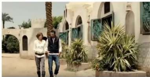
شكل (٢١) لقطات من فيلم "جدو حبيبي" ومواقع التصوير في الفيوم

https://www.youtube.com/watch?v=p63_z5P2vmc