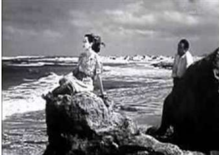
شكل (١٦) لقطة من فيلم "شاطيء الغرام"

ومن المقاصد السياحية الشاطئية التي ظهرت في الأفلام السينمائية المصرية، مدينة مرسى مطروح وشواطئها، خاصة صخرة شاطيء الغرام بمطروح التي سُميت على اسم فيلم "شاطيء الغرام" انتاج ١٩٥٠- اخراج هنري بركات- بطولة ليلى مراد، حسين صدقي، والتي تُعد من أهم مزارات مرسى مطروح حتى الآن، كذلك يُعد فيلم "جحيم تحت الماء" انتاج ١٩٨٩- اخراج نادر جلال- بطولة سمير صبري، ليلى علوي، والذي تم تصويره في الغردقة فيه ترويج غير مباشر للسياحة في البحر الأحمر وممارسة رياضة الغطس ومشاهدة الشعب المرجانية، كذلك فيه إشارة إلى تجريم صيد الأسماك بالديناميت، وظهر في الفيلم لقطات عديدة لأوتيل الشيراتون والذي كان على رأس أشهر أوتيلات الغردقة حينذاك.