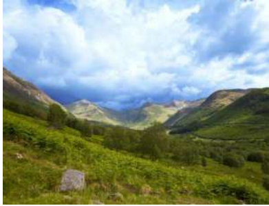
شكل (٣) موقع تصوير فيلم قلب شجاع في جلين نيفيس - اسكتلندا - https://www.youtube.com/watch?v=6O_DwtUdKwU

ثانياً: نماذج من أفلام السينما العالمية التي تم تصويرها في الدول العربية: