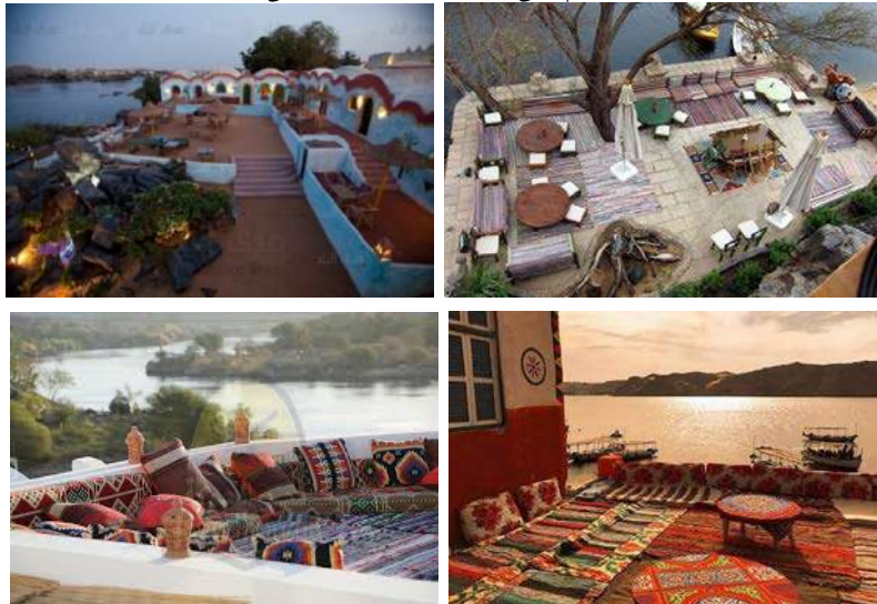
التراسات تستخدم (مقعد) مجمع للاجتماع وسهرات السمر للسانحين والاستمتاع بالأغاني النوبية وتلاحظ أنها لا تخلو من الزخارف النوبية بالألوان الساطعة لأقمشة التنجيد وكذلك الكليم ومفارش المناضد