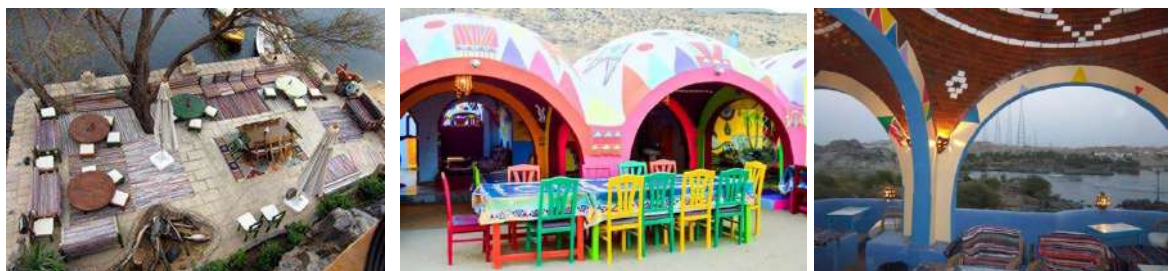
المطاعم المغلقة والمفتوحة المطلة على نهر النيل والاستمتاع بمنظر النيل مع البيئة النوبية من زخارف منتشرة على الجدران والحياة البينية البسيطة التي تعكس مدى تمسك النوبيين بعاداتهم وتقاليدهم فى البناء والتصميم الداخلى المبهج.