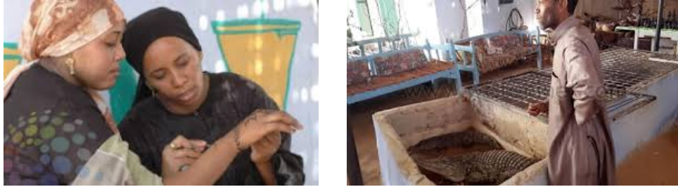
الصور توضح بعض من عادات النوبيين فجميعهم يربي التماسيح في بيوتهم ليضاهوا قدر ما يستطيعون حياتهم في النوبة القديمة، عندما كانت التماسيح تعيش بجوارهم على ضفاف النيل لكن بعضهم يؤكد أنهم يربون التماسيح فقط لإمتاع السائحين والصورة الثانية توضح رسم (الحناء) المشهورة به السيدات النوبيات