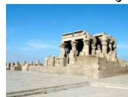
معبد كوم أمبو