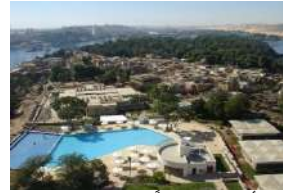
جزيرة أفنتين (جزيرة أسوان حالياً)