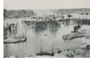
جزيرة فيلة الأثرية

درجة مئوية في فصل الصيف، الأمر الذي يجعلها واحدة من أشد بقاع الكوكب حرارة تشمل هذه المحمية الطبيعية على منطقة أخرى هي خور العلاقي، وهي الجزء المغمور من الوادي. ويعتبر هذا الخور هو الأكبر في بحيرة ناصر. إضافة إلى ذلك، يساهم الجزء المنخفض في وادي العلاقي في إيواء عدد كبير من السلالات المهدة بالانقراض مثل الغزال الدوركاسي والضبع المخطط والتمساح النيلي، والورل النيلي والسلحفاة ذات الظهر الناعم.