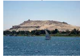
مقابر النبلاء (قبة الهوا)