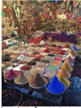
الهدايا من الحرف اليدوية والعطارة الأسوانية