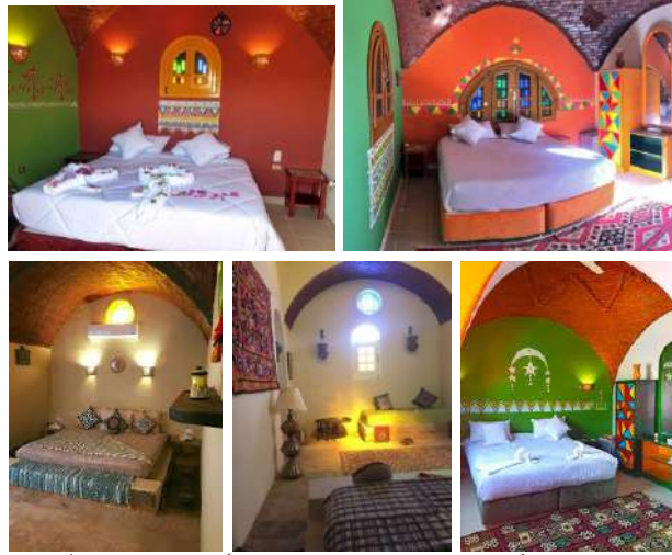
الغرف الفندقية مع اختلاف تصميمها إلا أنها لا تخلو من الطابع النوبي الأصيل سواء كان في العمارة أو التصميم الداخلي