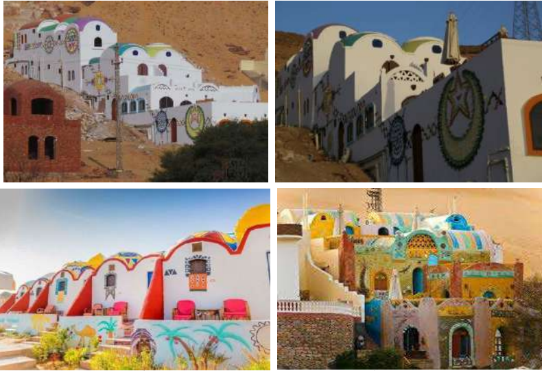
التصميم المعماري لبيوت والفنادق النوبية على شكل قباب، وتدهن عادة باللون الأبيض الذي يقيهم من حرارة الشمس الرسم على الحوائط عادة وتراث نوبى