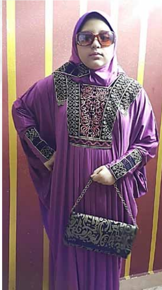
صورة رقم(11) توضح التصميم السابع للعباية والطرحة والحقيبة المستوحاة من الملابس السيناوية.