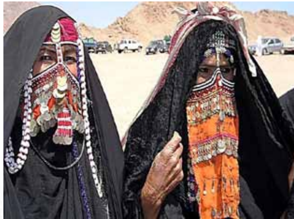
صورة رقم (3) توضح أشكال لبعض أغطية الرأس والبراقع للملابس السيناوية .

وللثوب السيناوى أشكال متعددة.. فمنها ثوب الأعياد والمناسبات والحج الذى يتميز بلون التطريز الفاتح، وثوب الحامل الواسع والذى يتميز باللون الأشهب، وثوب الماتم متميزاً باللون الأزرق الغامق.