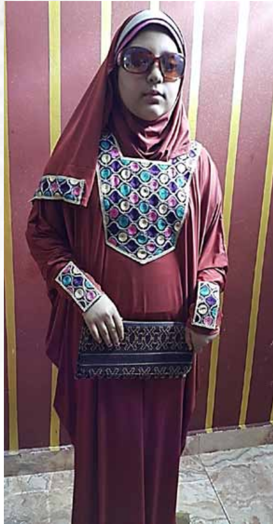
صورة رقم(15) توضح التصميم الحادى عشر للعباية والطرحة والحقيبة المستوحاة من الملابس السيناوية.