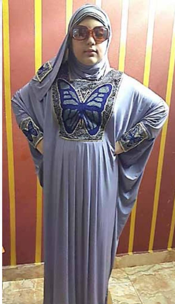
صورة رقم (9) توضح التصميم الخامس للعباية والطرحة المستوحاة من الملابس السيناوية.