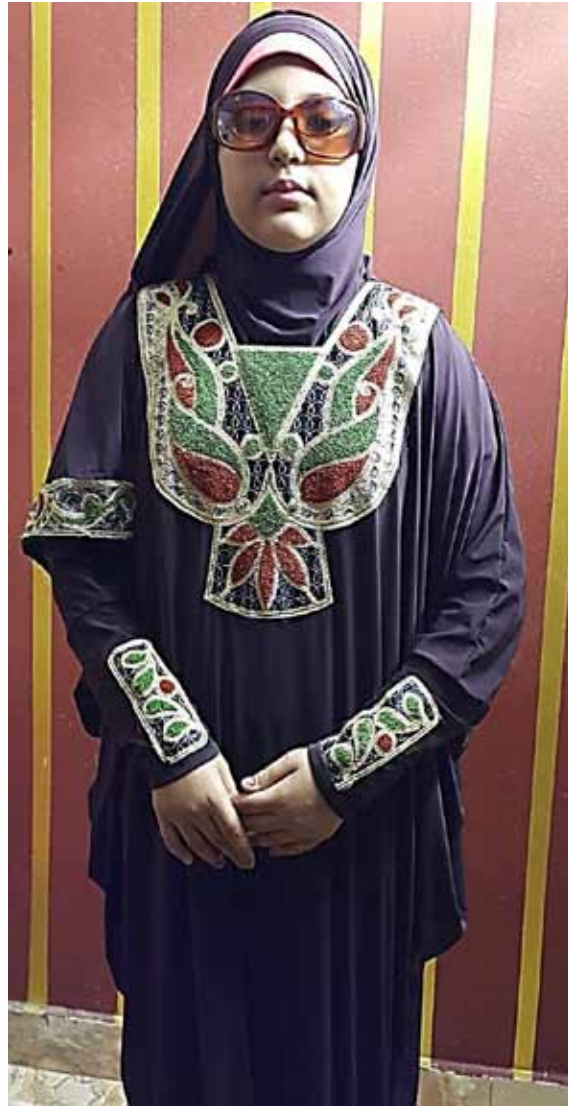
- التصميم الثامن :-

صورة رقم (12) توضح التصميم الثامن للعباية والطرحة المستوحاة من الملابس السيناوية.