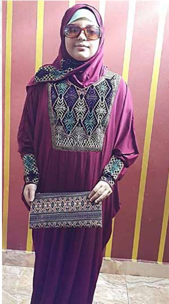
صورة رقم(13) توضح التصميم التاسع للعباية والطرحة والحقيبة المستوحاة من الملابس السيناوية.