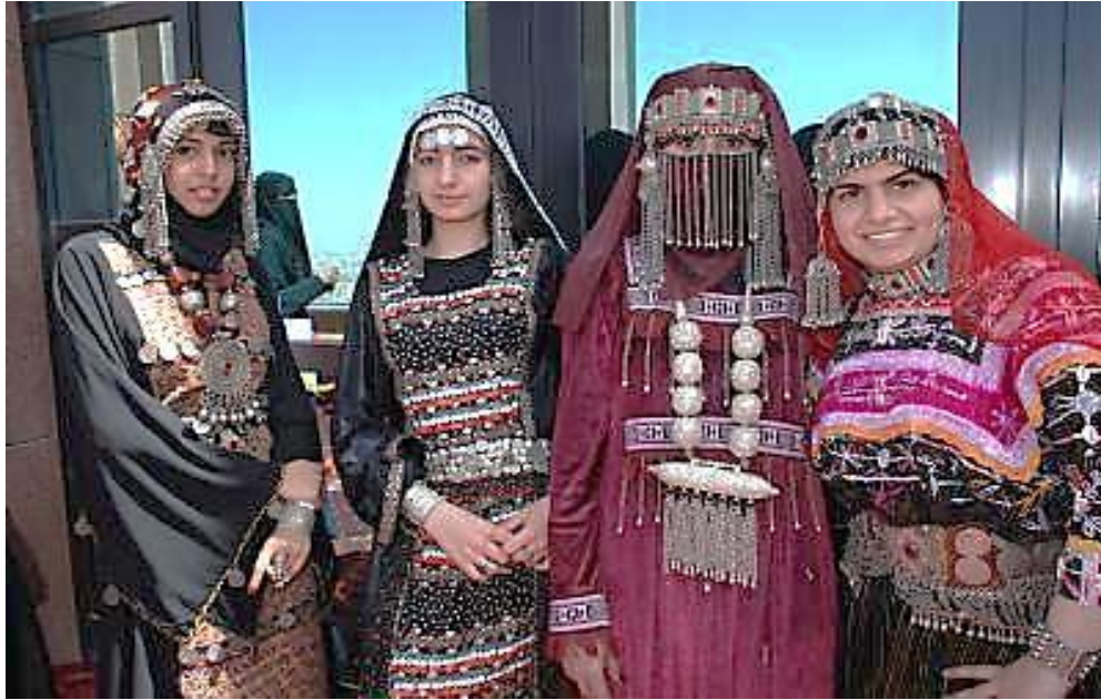
صورة رقم (2) توضح أشكال للملابس السيناوية ومكملاتها في مناسبات مختلفة .

ومن بينها الأزياء والحلى.. حيث تعد الأزياء الشعبية والحلى بمختلف أنواعها وأشكالها لوثاً من ألوان الثقافة الشعبية والتراث الشعبي، حيث أن الزي السيناوي يمتلك في حد ذاته مبررات قوية للإهتمام به.. كما أنه رسالة تحمل كل معتقدات وفنون المجتمع القبلي وعاداته وتقاليده الشعبية ، وبها يعكس ثقافة المجتمع في سيناء.(2)