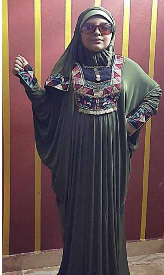
صورة رقم(10) توضح التصميم السادس للعباية والطرحة المستوحاة من الملابس السينماوية.