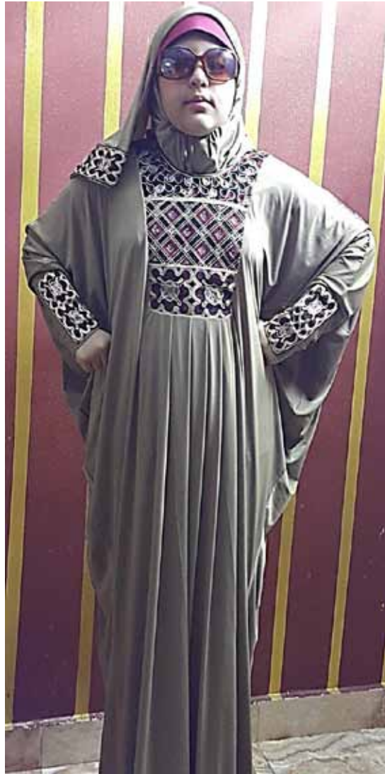
صورة رقم(14) توضح التصميم العاشر للعباية والطرحة المستوحاة من الملابس السيناوية.