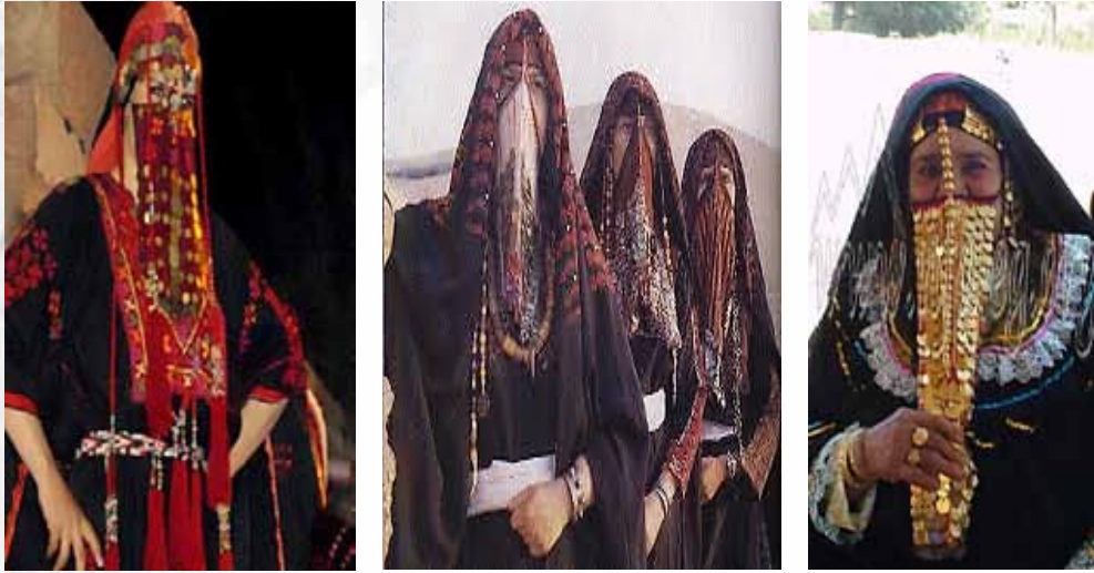
صورة رقم (4) توضح أشكال للأحزمة والبرافع للملابس السيناوية .

وتوشح المرأة بحزام الوسط الذي يحيط بخصر المرأة ويسمى (المقوط)، ويكون محاطاً بشريط مصنوع من شعر الماعز باللونين الأسود والأحمر ومزين بحبات الودع الأبيض ويلف على المقوط ثلاث مرات ويسمى (مريرة) .. كما تضع المرأة على وجهها البرقع كما في صورة رقم (4)، ولكل قبيلة برقع يميزها عن القبائل الأخرى من حيث الشكل واللون. (13)