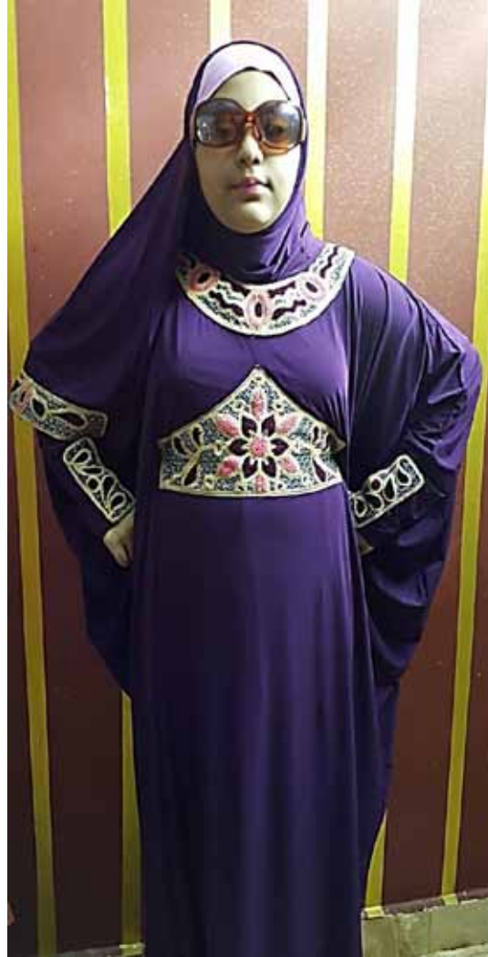
صورة رقم(6) توضح التصميم الثانى للعباية والطرحة المستوحاة من الملابس السيناوية.