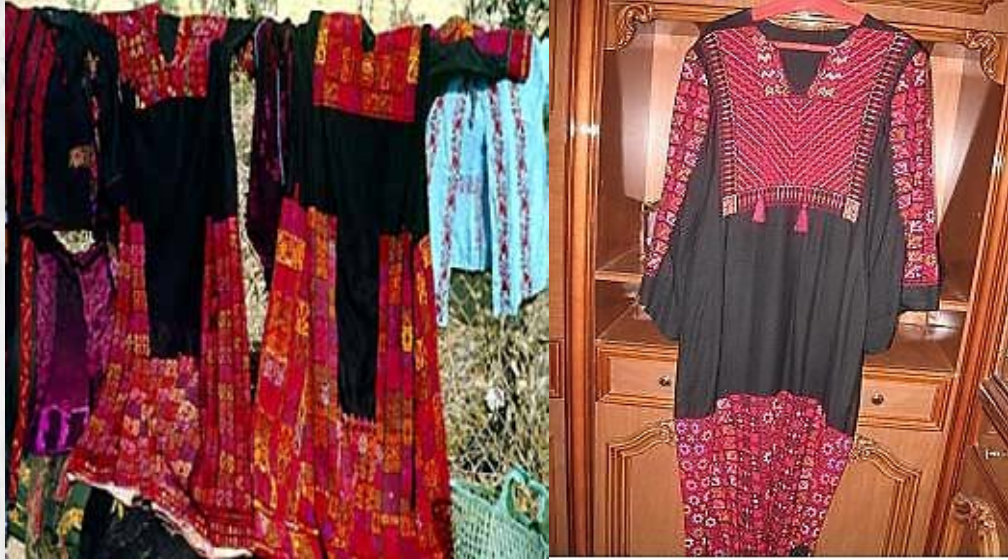
صورة رقم (1) توضح بعض أشكال للملابس السيناوية .

يعد الثوب البدوي السيناوي أحد مفردات التراث الأصيل وعلامة مميزة من علامات تراث سيناء.. بل هو سمة من سمات المرأة البدوية.. ويمكن من خلاله معرفة القبيلة أو العائلة حسب شكل هذا الثوب المزركش والمشغول يدويا من أوله إلى آخره، وذلك من خلال اللون.. بل والشغل أو القضبنة (الغرزة) التي تدخل في صناعته.