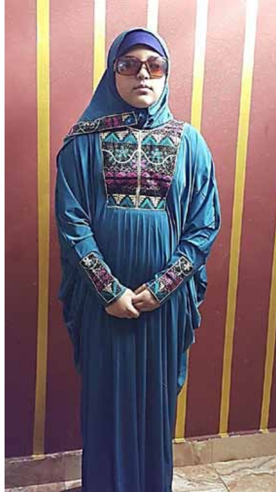
صورة رقم (8) توضح التصميم الرابع للعباية والطرحة المستوحاة من الملابس السيناوية.