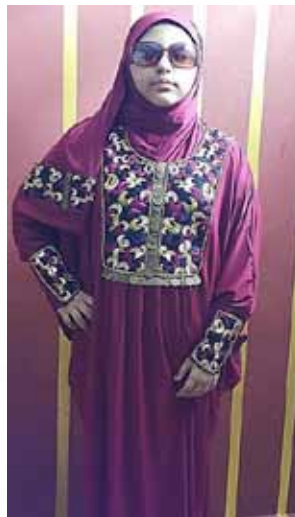
صورة رقم(5) توضح التصميم الأول للعباية والطرحة المستوحاة من الملابس السيناوية.