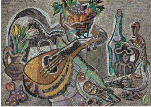
ازهار وأخرى بها فواكه مختلفة وبعض طيور الحمام

عد بريكر أحد الفنانين الذين بدأوا في إبداع لوحات الفسيفساء الصغيرة ، وقد شاركه في ذلك فنانون آخرون ، حيث بدأه جينو سيفيرني ، وكلمت وبيكاسو ، وجورج يراك وغيرهم في أوروبا تأثيره عظيماً خلال أوائل القرن العشرين ، وينظر إليه باعتباره أحد هم المنظرين لفن الفسيفساء فكانت لسيفيرني نظرة مختلفة للفسيفساء وتأتي أهمية سيفيرني أيضاً في كونه يصمم وينفذ أعماله الصغيره بنفسه أما أعماله الكبيرة ، كان ينفذها حرفيون من رافنا وتوالت بعد ذلك لوحاته الصغيرة نذكر منها لوحتين : اللوحة الأولى تمثل طبيعة صامتة ومندولين