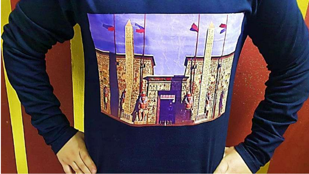
صورة رقم (١) توضح التصميم ومطبوع عليه صورة توضح معبد الأقصر.