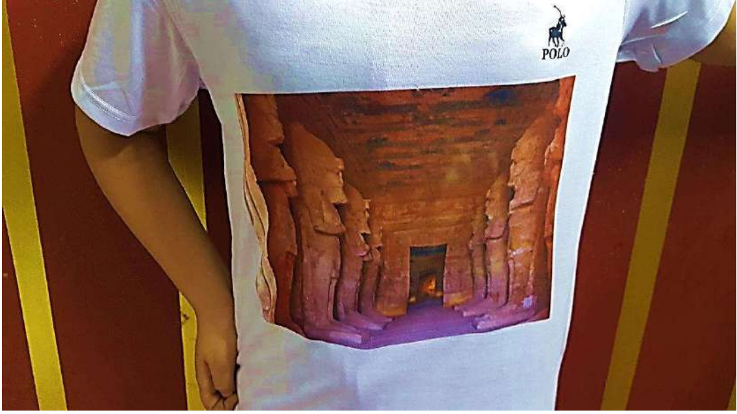
صورة رقم (٣) توضح التصميم ومطبوع عليه صورة توضح معبد أبو سمبل.